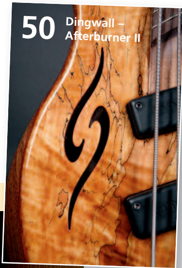
50 Dingwall – Afterburner II