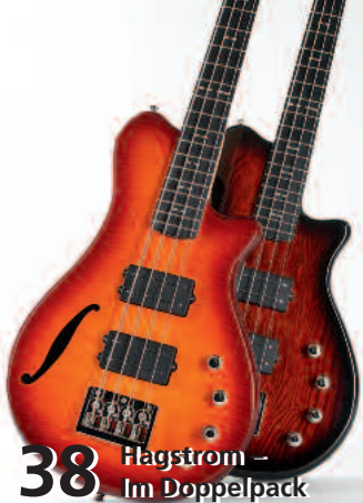
38 Hagstrom – Im Doppelpack