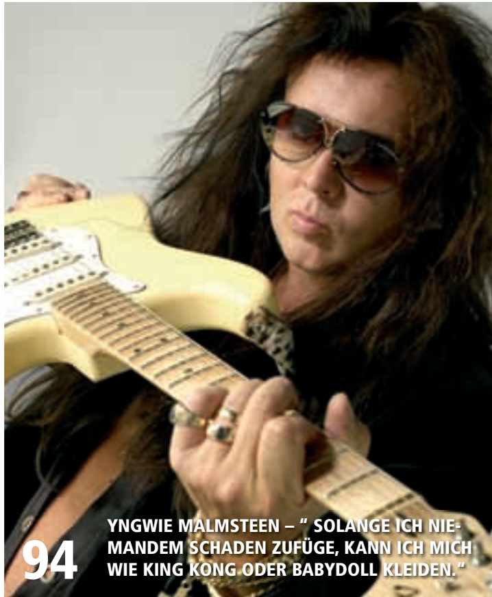
94 YNGWIE MALMSTEEN – "SOLANGE ICH NIEMANDEM SCHADEN ZUFÜGE, KANN ICH MICH WIE KING KONG ODER BABYDOLL KLEIDEN."