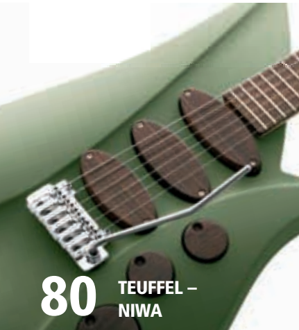
80 TEUFFEL – NIWA