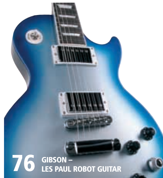
76 GIBSON – LES PAUL ROBOT GUITAR