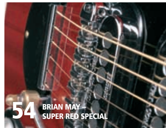
54 BRIAN MAY – SUPER RED SPECIAL