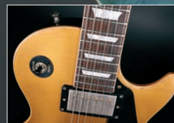
GIBSON LES PAUL BONAMASSA