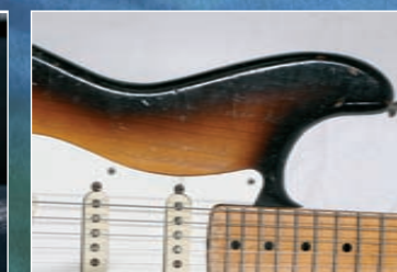
VINTAGE ELECTRIC FENDER 56 STRAT