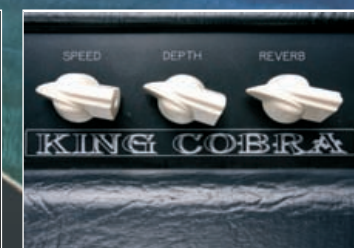
MATCHLESS KING COBRA