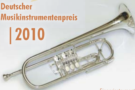
Siegerinstrument B-Trompete T 053/B-L

Ricco Kühn Metallblasinstrumentenbau Chemnitzer Straße 68 D-09569 Oederan