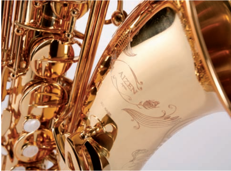
Schallbecher-Maß mit 150 mm knapp unterhalb vom Selmer 80 SA (154 mm)