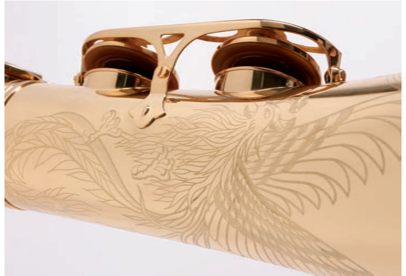
Tonlochränder mit aufgelötetem Bördelring, gutsitzende Polster bei geschlossenen Klappen