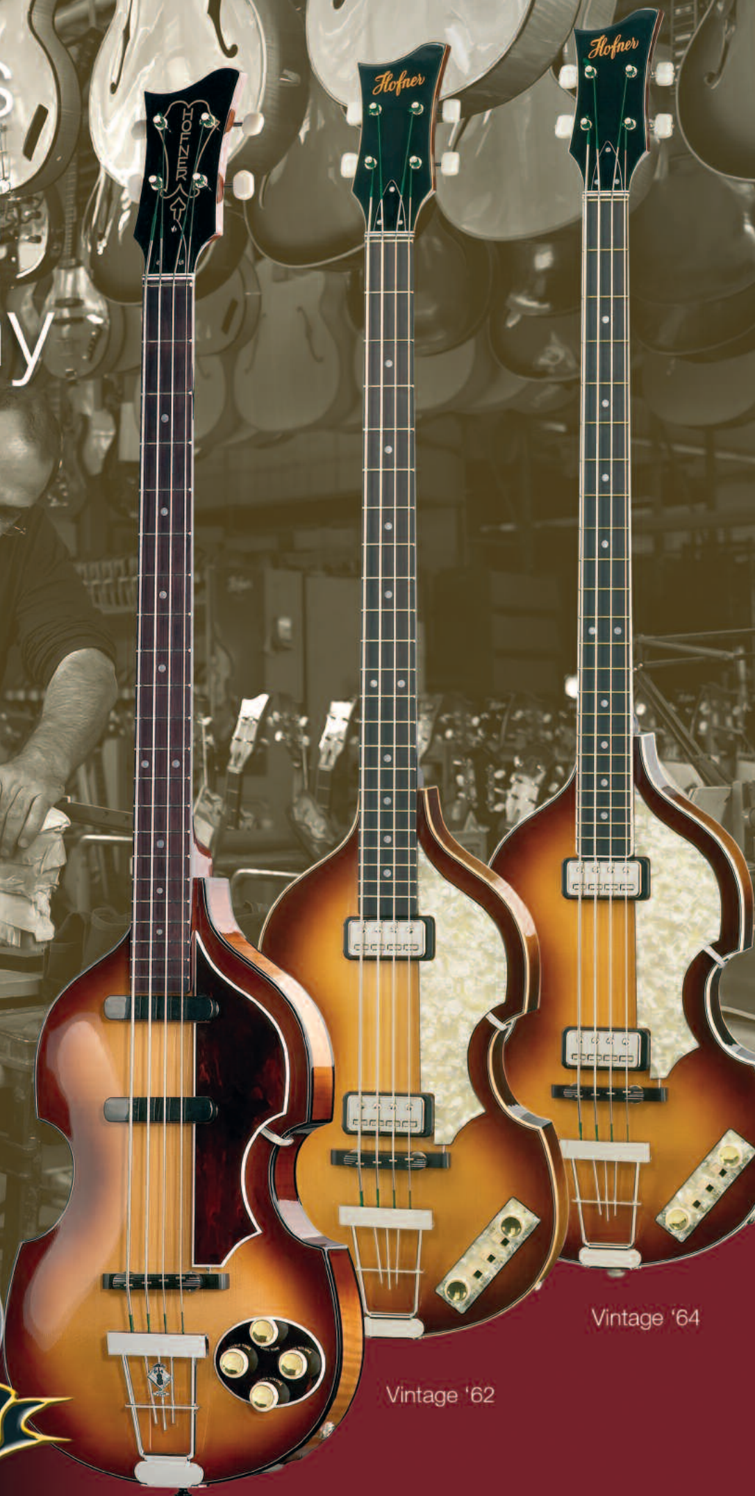
Vintage '64 Vintage '62