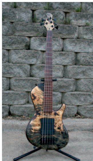
Pavel Aryel Deluxe 5

Die Bässe des amerikanischen Bassbauers Pavel de la Fuente sind hierzulande noch komplett unbekannt. In den USA hingegen sind sie derzeit der absolute Geheimtipp und werden in einem Atemzug mit anderen High-End-Bässen wie Fodera, Alembic oder Alleva-Coppola genannt. Pavel bietet momentan sieben verschiedene Bassmodelle an, vom J-artigen Hadara über den Tzack bis hin zum Aryel Single Cut. Alle Instrumente sind custom made, spezielle Kundenwünsche können so jederzeit berücksichtigt werden. Bassisten wie Victor Wooten, Matt Garrison oder Janek Gwizdala haben die Bässe bereits angetestet und sind begeistert. Gospelbassist Terrance Palmer schwört auf Pavel-Bässe. Aufgrund der hohen Nachfrage ist die Lieferzeit derzeit fast ein Jahr, daher wird Pavel in Kürze ein neues Modell vorstellen, welches einfacher in der Produktion ist und die Wartezeit für interessierte Bassisten erheblich verkürzen wird.