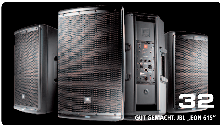
GUT GEMACHT: JBL „EON 615“