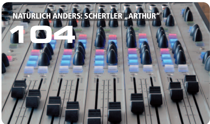
NATÜRLICH ANDERS: SCHERTLER „ARTHUR“