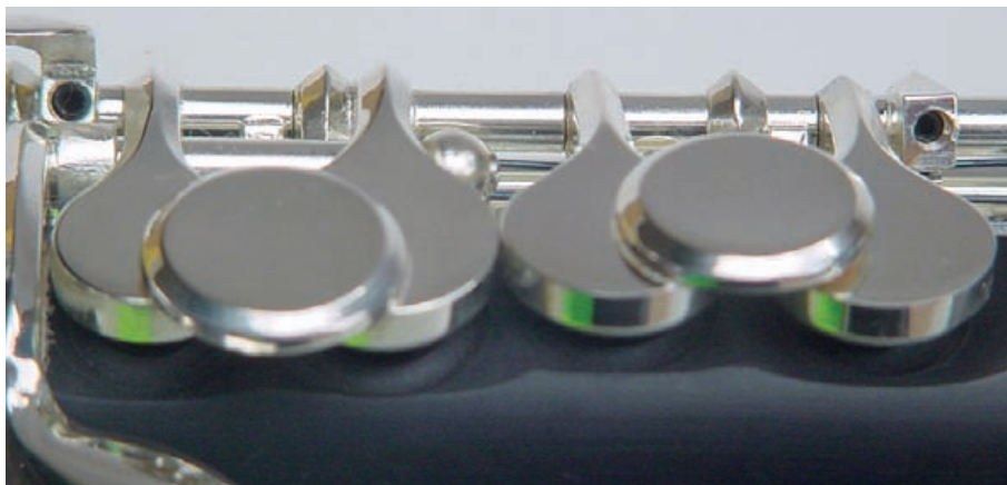
Der Sitz der Inbusschrauben ist gut versteckt