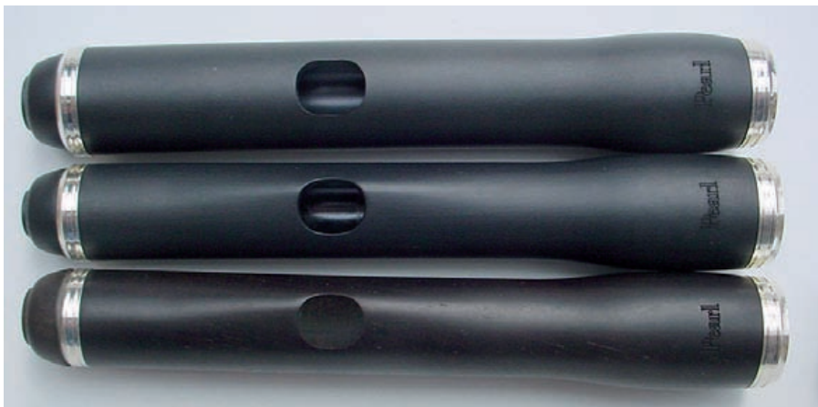
oben: „Grenaditte“ regulär, Mitte: „Grenaditte“ verdünnt, unten: Holz verdünnt