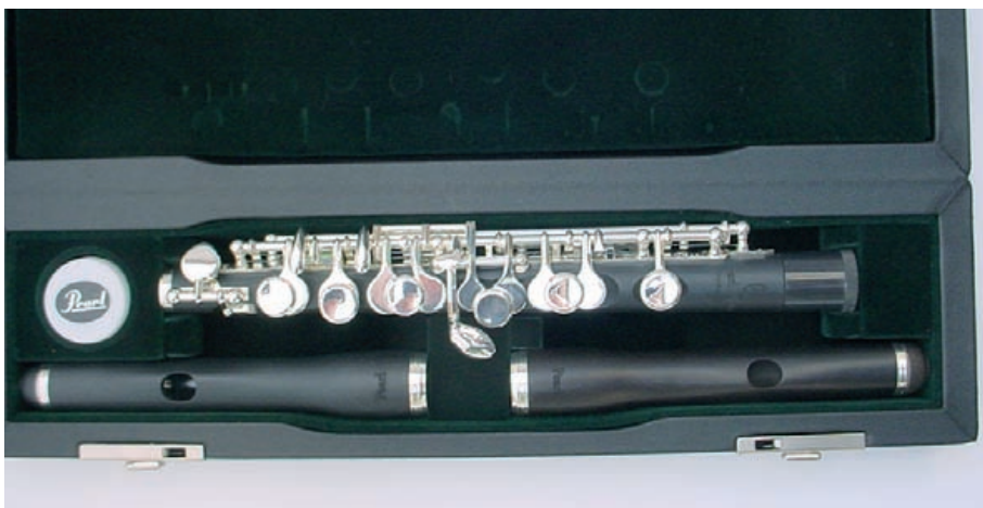
Das Etui bietet Platz für ein zweites Kopfstück

Das Instrument kommt in einem mit echtem Leder überzogenen Holzkern-Etui. Es bietet für alle Fälle Platz für ein zweites (Pearl-)Kopfstück, und natürlich für ein Döschen mit Korkfett. Dazu gehört eine Teddy-gefüllte Etuitasche mit Handgriff aus Stoff. Seitlich ist ein Reißverschlussfach, das den beiliegenden Messing-Wischerstab nebst einem Mini-Gazetuch zum Wischen der Bohrung aufnehmen kann. Dazu gibt es ein Pflegetuch für die Außenseite des Instruments. Das Pearl Piccolo kommt – anders als 2006 – mit einer Abdeck-Kappe für den Zapfen, damit das Etui nicht durch den eingefetteten Zapfen verschmutzt wird. ■