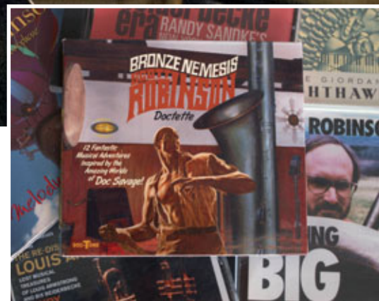
CD-Covers, obenauf die neue Platte „Bronze Nemesis“