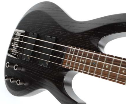
44 /// LTD B-334