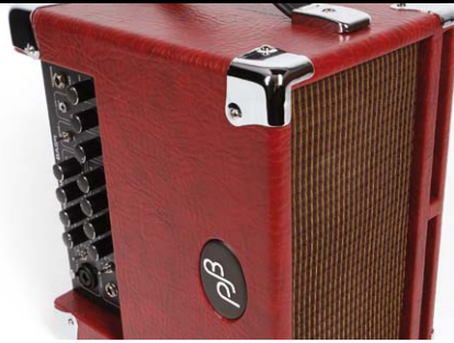
96 /// Phil Jones Bass Cub BG-100