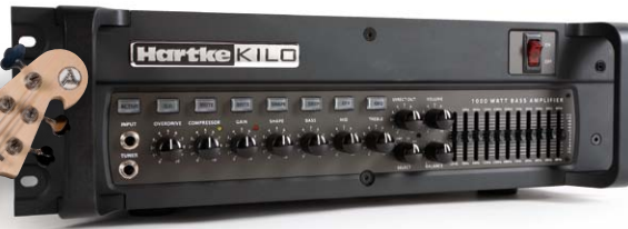
92 /// Hartke Kilo