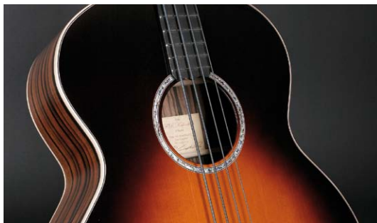
8 /// Kallenbach „The Gnome“