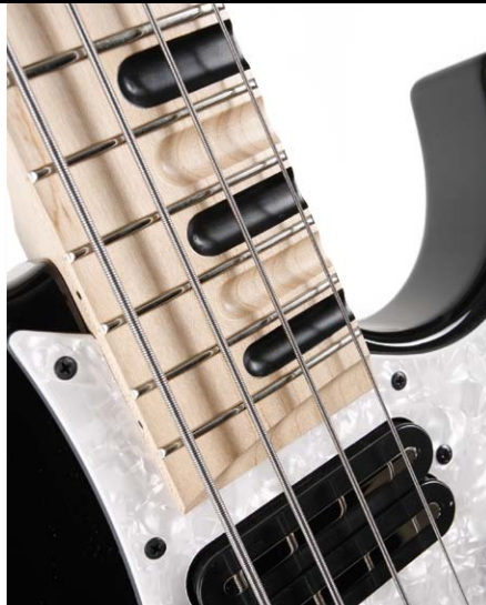
48 /// Yamaha Attitude Ltd.