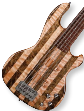
24 /// Hot Wire Inlaw