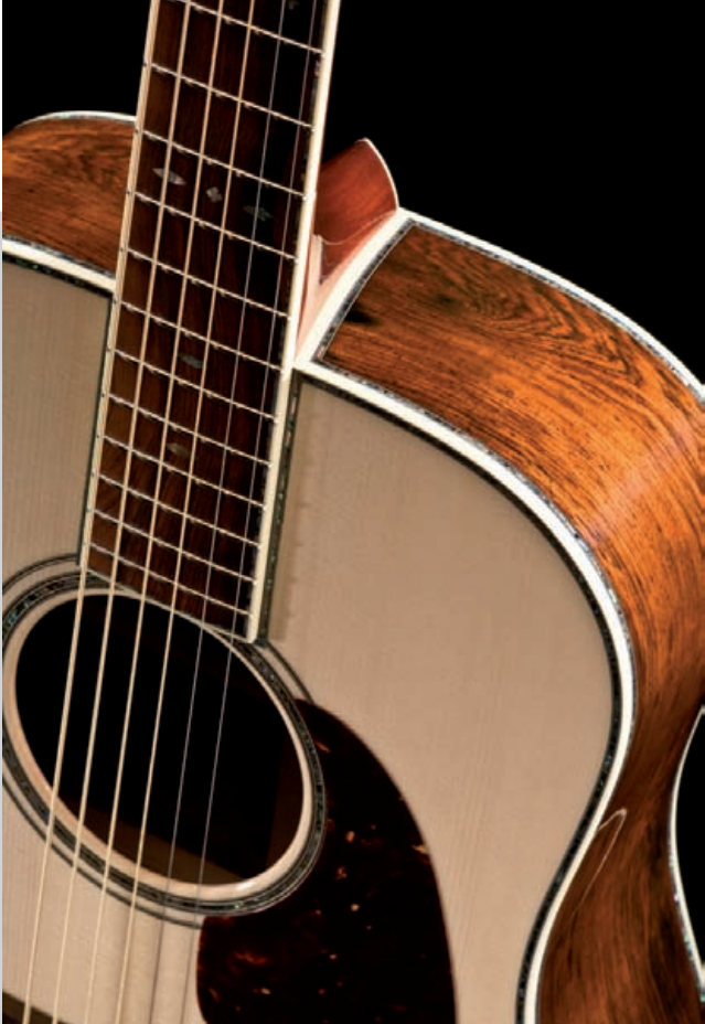
Santa Cruz D Modell