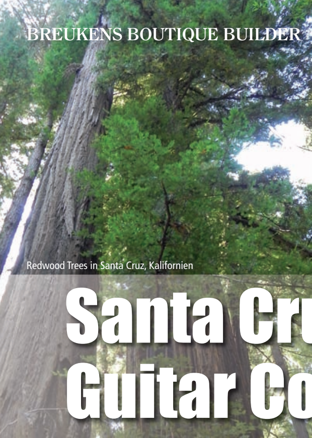
Redwood Trees in Santa Cruz, Kalifornien