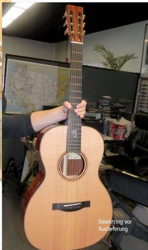
Steelestring vor Auslieferung