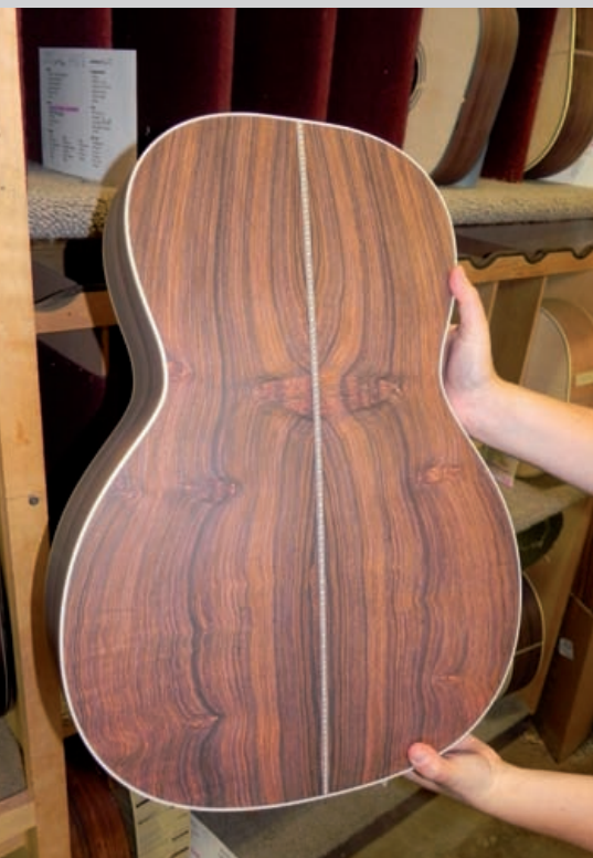
Teilfertige Instrumente mit wunderschönen Hölzern