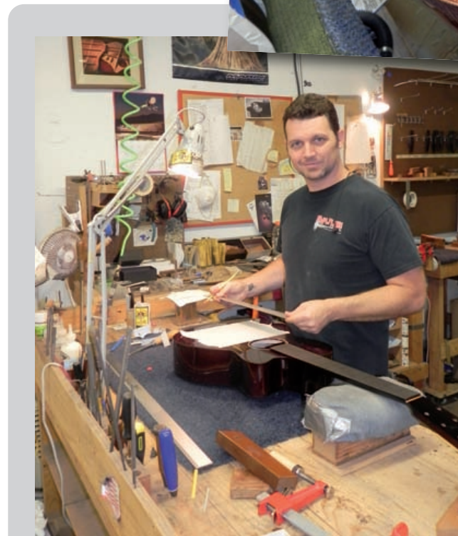
Bei der Arbeit