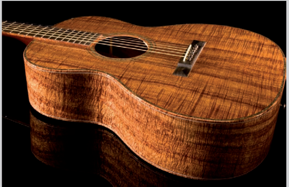
Santa Cruz Custom H13