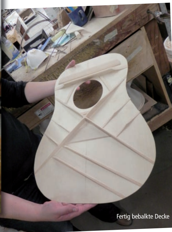
Fertig bebalckte Decke