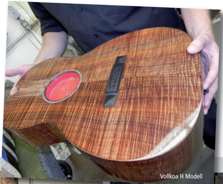
Vollkoa H Modell

rauf, jede Gitarre in klanglicher Hinsicht so formen zu können, dass sie den Wünschen des Kunden entspricht. Bei uns gibt es keine Zufallsprodukte, die manchmal ganz gut klingen und manchmal halt nicht. Selbst viele sehr kleine Hersteller machen es wie Taylor, sie