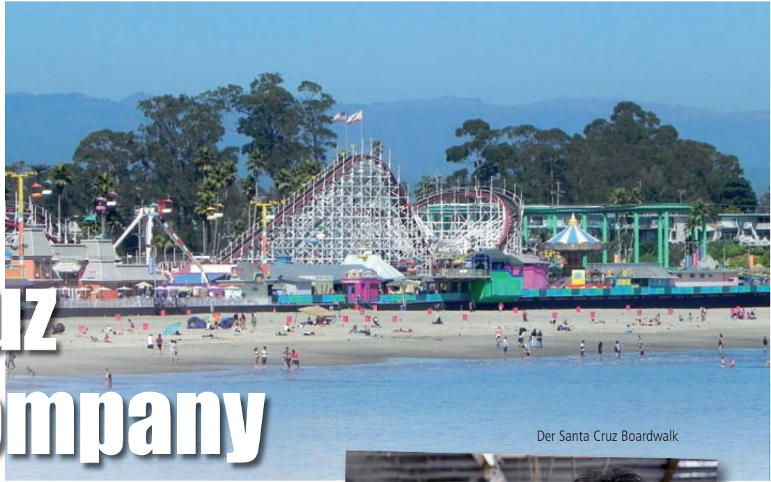
Der Santa Cruz Boardwalk