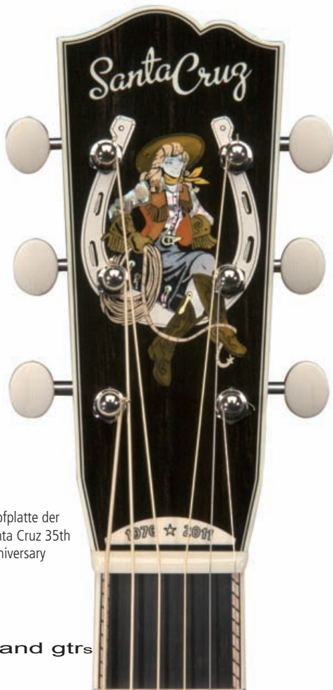
Kopfplatte der Santa Cruz 35th Anniversary