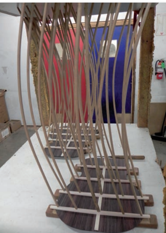
Decken werden bebalckt und eingespannt