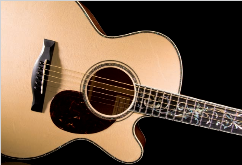
Santa Cruz F Fingerstyle Modell