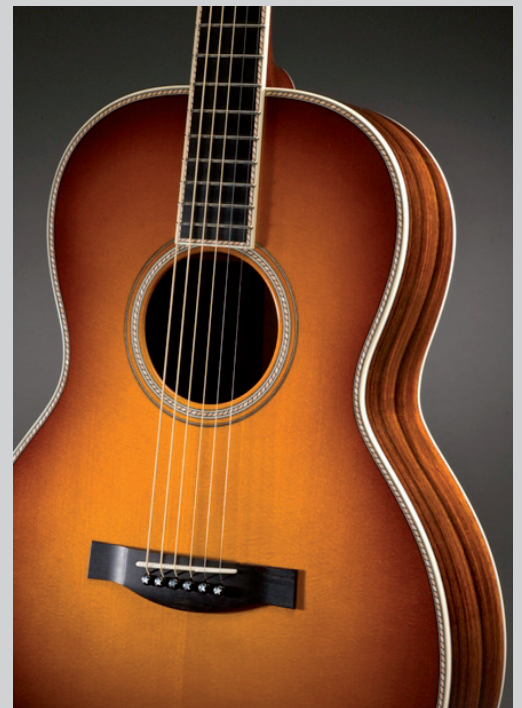
Santa Cruz 35th Anniversary Modell

Santa Cruz das Modell H) oder die J-45 und erfand eigene Formen wie F (Minijumbo), Firefly (Reisegitarre) und Baritone. Die Liste der Spieler und Liebhaber ist ellenlang. Große Namen wie Joan Baez, Eric Clapton, Bill Frisell, Glen Frey, Dickey Betts, Elvis Costello oder Brad Paisley sind ebenso im Boot wie viele Musiker hinter den Kulissen. Kaum ein amerikanischer Hersteller hat seinen Ruf so gefestigt und ist trotzdem seiner Größe und seinem Konzept so treu geblieben wie dieser.