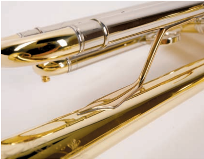
Filigranere Optik bei den Streben

eine entscheidende Wirkung mit sich gebracht. Bemerkenswert ist die Klangcharakteristik, besonders deren Gleichmäßigkeit, die über den gesamten Dynamikumfang erhalten bleibt. Der Ton klingt satt und voll, hat einen tiefen Kern, verbunden mit einer weichen Grundfärbung. Obertönigkeit ist leicht vorhanden, der Sound in keiner Weise aufdringlich. Bei diesem Klang ist der klassische und solistische Einsatz besser vorzunehmen als bei der 180-37. In Blechbläserensembles