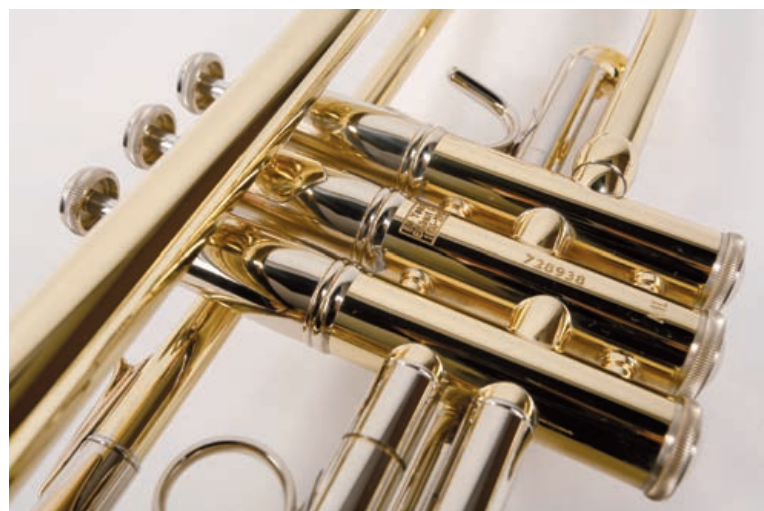
...Nickel / Messing Ventilhäusen: Modell 190-37