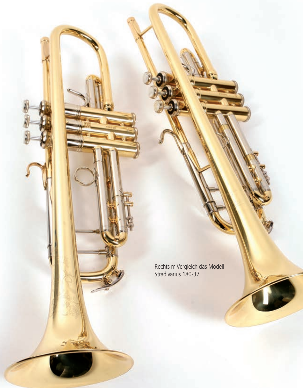
Rechts im Vergleich das Modell Stradivarius 180-37

Da die Jubiläumstrompete ebenfalls ein 37er Modell ist, ist im ersten Moment kein großer Unterschied zum Traditionsmodell erkennbar. Doch bei genauer Betrachtung fallen optisch einige Änderungen auf, die in die historische Richtung gehen. Zunächst einmal wurde der Fingerhaken auf dem Mundrohr durch das Vintage-Modell im Retrodesign ersetzt. Er besteht aus einer hochwertigeren und engeren Bauweise, die den kleinen Finger der rechten Hand besser führt. Die 190-37 wurde auch mit dem 25er Messing-Mundrohr und zwei Querstegen, einer zwischen Mundrohr und Anstoß und ein weiterer am Messingstimmzug, ausgestattet. Eine Konstruktionsänderung sind jedoch die Ventilhülsen. Dabei handelt es sich um eine zweiteilige Bauweise, deren oberer Teil aus Nickel und der untere aus Messing besteht. Dieses Konstruktionsmerkmal wurde bereits in der Artisan-Serie aufge-