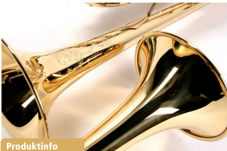
Aufwendige Bechergravur und ...