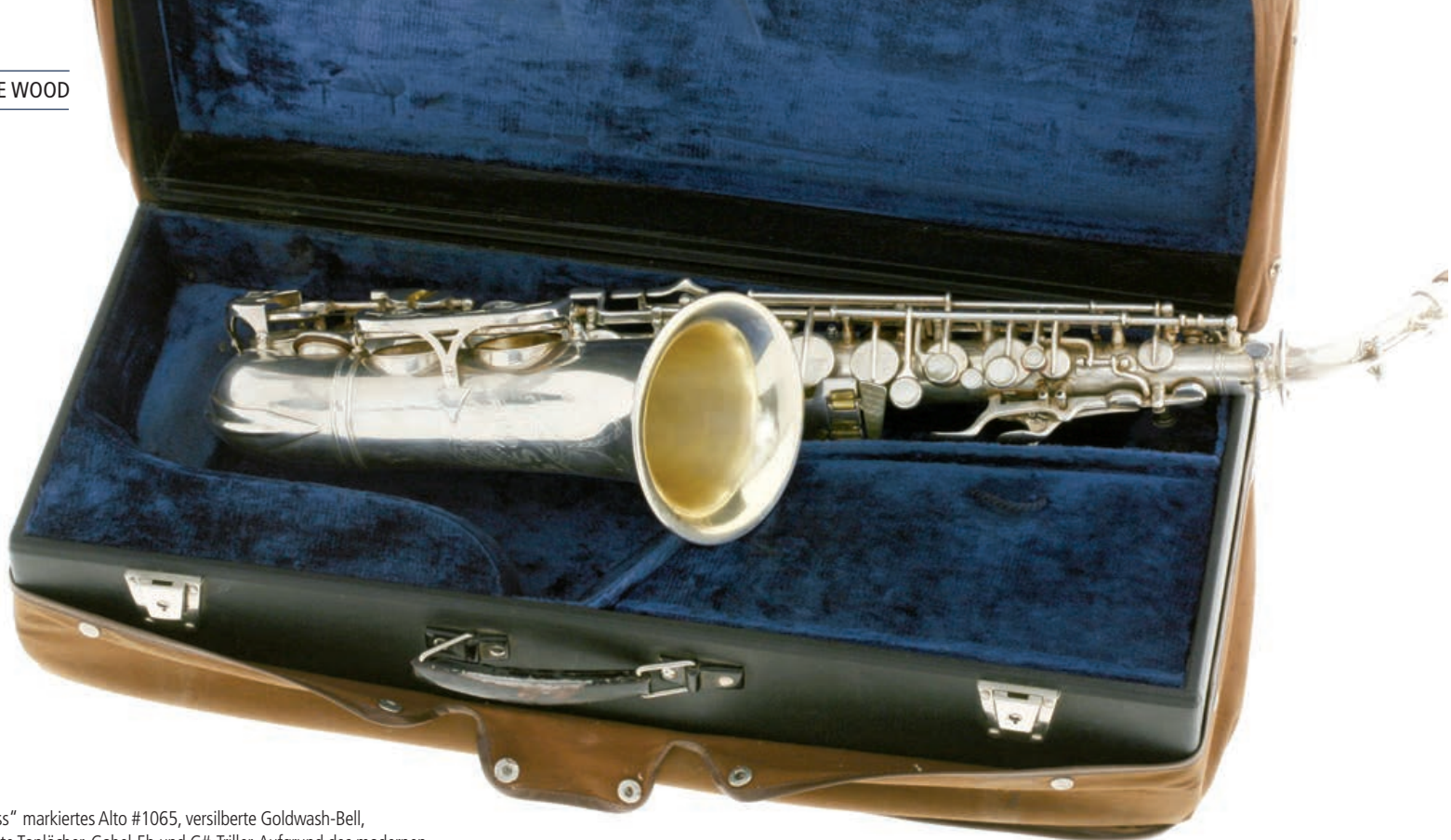
Mit „Hess“ markiertes Alto #1065, versilberte Goldwash-Bell, gebördelte Tonlöcher, Gabel-Eb und G#-Triller. Aufgrund des modernen Klappenschutzes wahrscheinlich ein Instrument, das nach dem Krieg von Hess vertrieben wurde