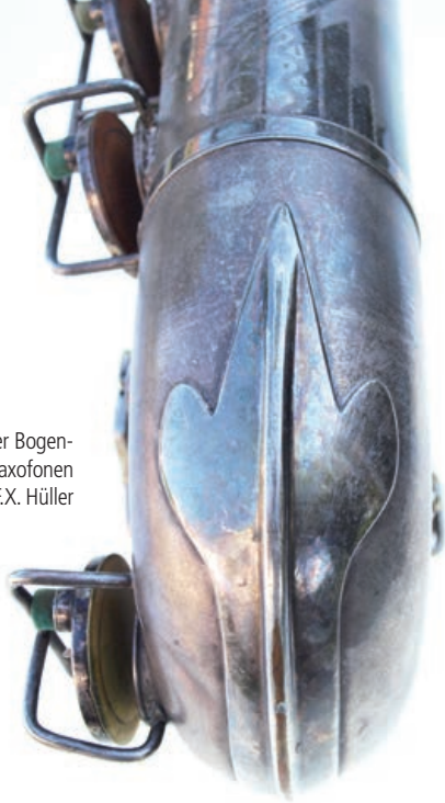
Typischer Bogenschutz auf Saxofonen von F.X. Hüller

Blechblasinstrumenten nur diese beiden Spielzeug-Saxofontypen beworben. Richtige Saxofone wurden möglicherweise erst später hinzugenommen und zwar nur dazugekauft – in einem Hess-Katalog von vor 1945 ist ein Alto mit Hess-Gravur abgebildet, das identisch mit der zeitgenössischen Bauweise von F. X. Hüller/Graslitz ist. Merkmale: Feinstimmer mit drei Ringen, blattförmiger Bogenschutz, spezielle Korpus-/Becherverbindung.