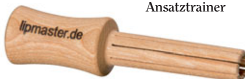
46 Lipmaster Ansatztrainer