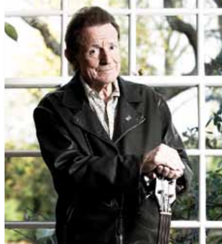
58 /// Jack Bruce