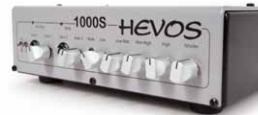
82 /// Hevos 1000S