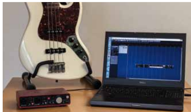
102 /// Special: Record Your Bass