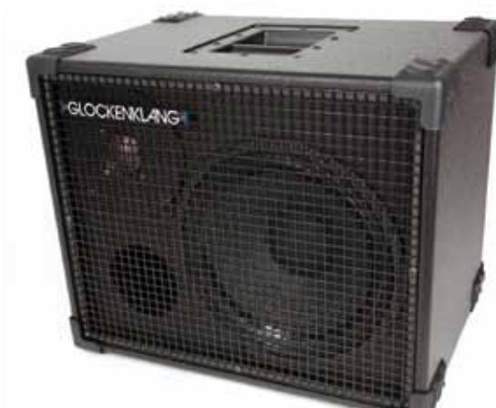
94 /// Space Art 1x12