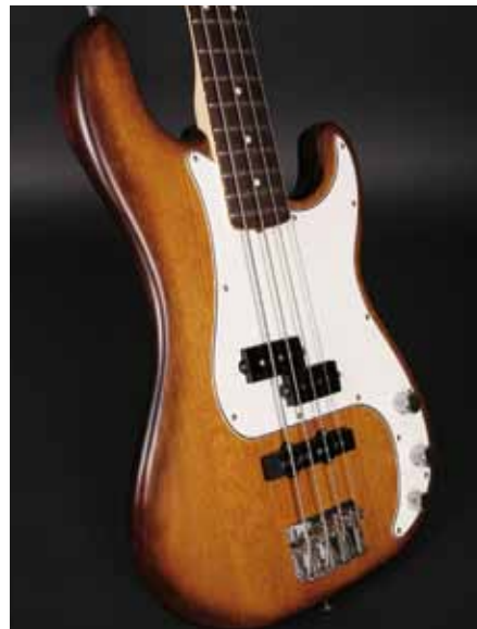
36 /// Fender PJ Special