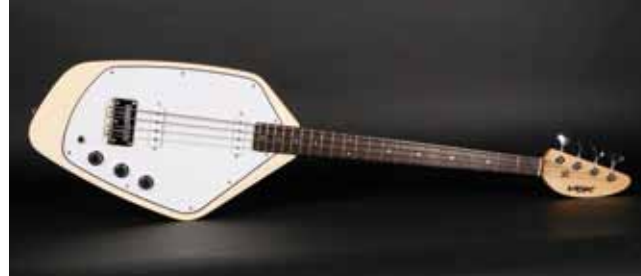
24 /// Vox Mark 5