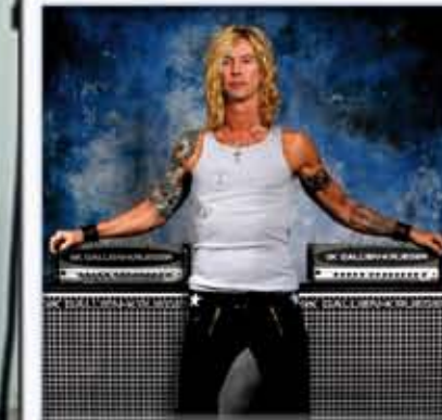
Duff McKagan - Velvet Revolver