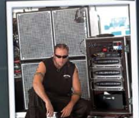
Marco Coti Zelati - Lacuna Coil