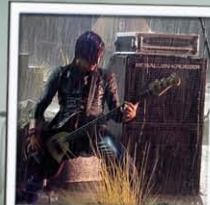
Tim Foreman - Switchfoot