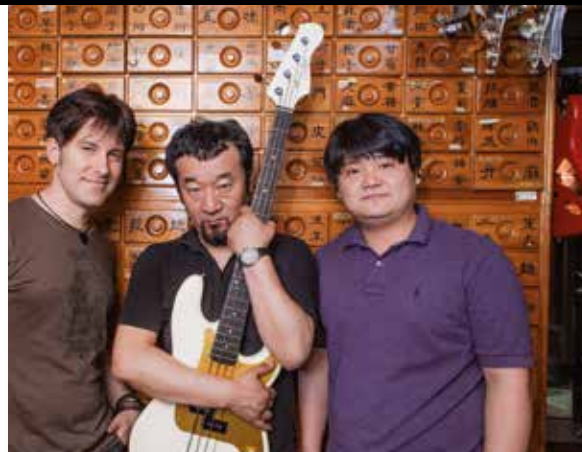
78 /// Moollon Basses