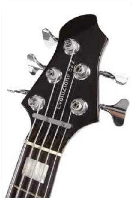
22 /// Rinaldis Evoluzione