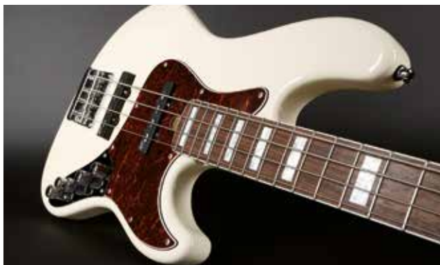
34 /// Mayones Jabba Classic