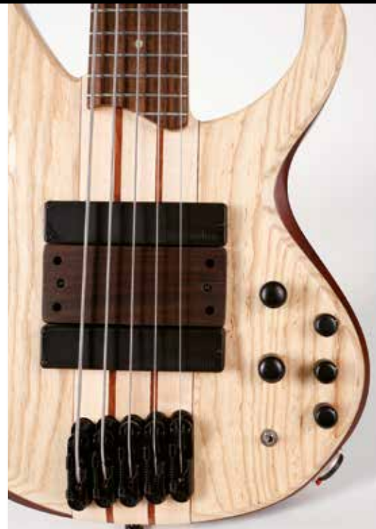
38 /// Ibanez BTB33 Volo