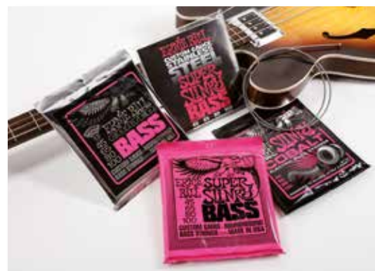
46 /// Ernie Ball Basssaiten