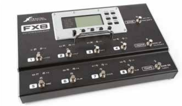
82 /// Fractal Audio FX8 & Axe-FX II XL+