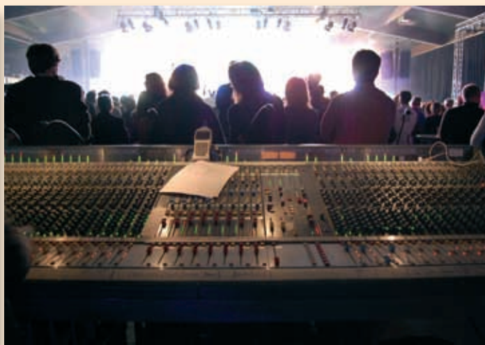
Arbeitsplatzansicht: „Europa“ beim Gig