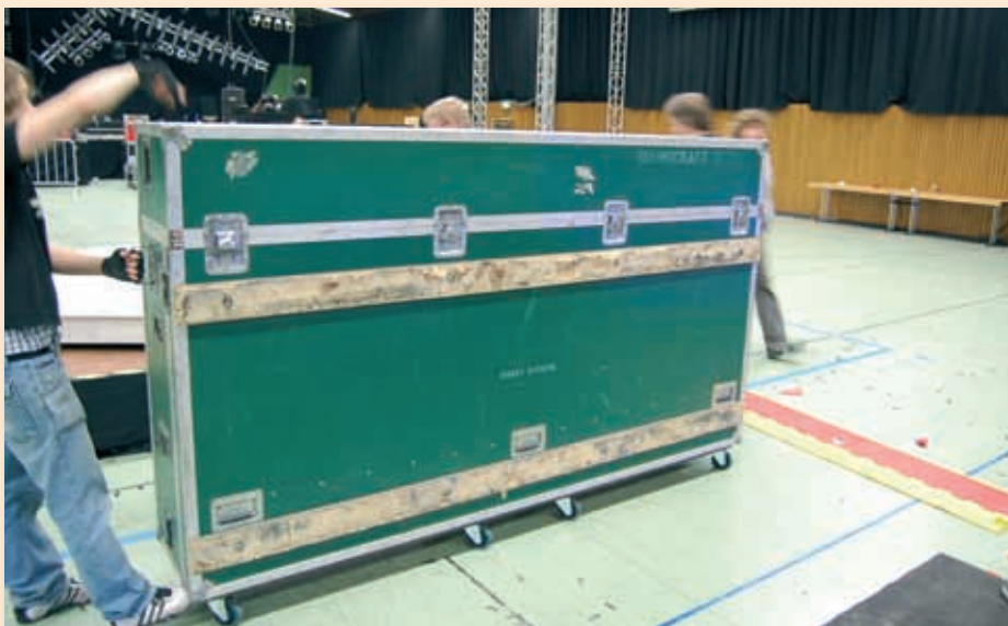
Bild 3: Der Größenvergleich zeigt es: Mann gegen Monster - das Case

Im klassischen Vintage Design informieren zwei große VU-Meter über den Pegel zur P.A. Wie bei Soundcraft üblich befinden sich im Masterteil eine Reihe zusätzlicher Ausgangsregler und das Grundmodell enthält sogar 8 Stereo>Returns mit einfachen Equalizern! Wer jetzt meint, das Pult wäre nur von eingefleischten Spezialisten bedienbar gewesen, der täuscht sich. Soundcraft hatte bei der Programmierung der VCA- und Mute-Gruppen eine beispielhaft gelungene Bedienroutine entwickelt. Kaum ein Pult war so selbsterklärend und intuitiv nutzbar wie das „Europa“.