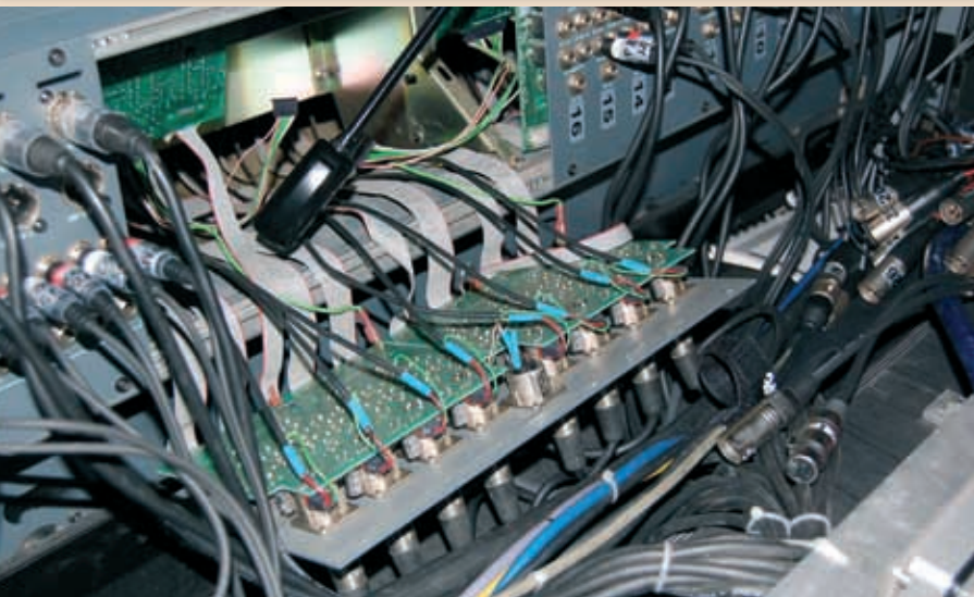
Bild 4 und 5: Ein LED-Ketten-Modul als 4er Einheit - so schnell gelangt man an wichtige Baugruppen: Modulbausweise

angeboten, aber auch Schnäppchen ab 5.000 Euro sind gesichtet worden. Trotz aller Begeisterung für die Features des uneingeschränkt Rider-tauglichen Pults darf nicht übersehen werden, dass bereits zum Aufstellen des Riesen vier bis fünf gestandene Männer vollen Einsatz zeigen müssen. Vom Platzbedarf im LKW und Lager mal ganz abgesehen. Sogar an die Tragfähigkeit des Bodens sollte gedacht werden. Ich habe schon Festzeltböden gesehen, die bereits beim Hereinrollen der Konsole deutlich machten, dass für diese Location eindeutig die falsche Konsole eingeplant wurde.