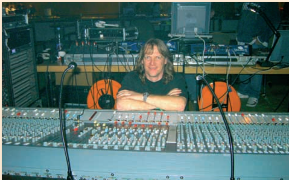
Der Autor und sein „Europa“