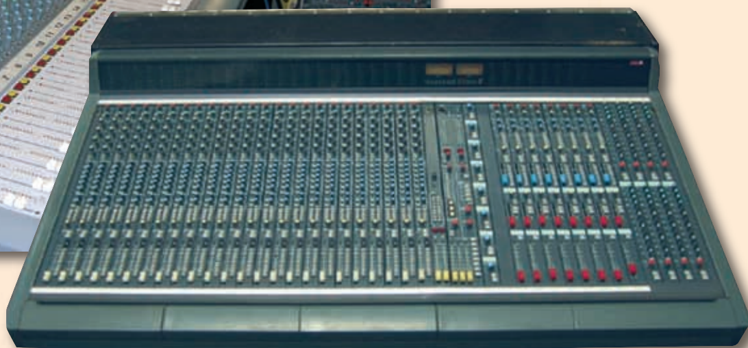
Bild 2: Soundcraft „Vienna II“ mit 24 Mono- und 8 Stereo-Eingängen