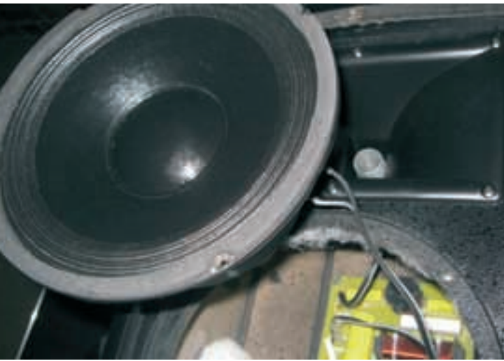
Innenleben des Satelliten