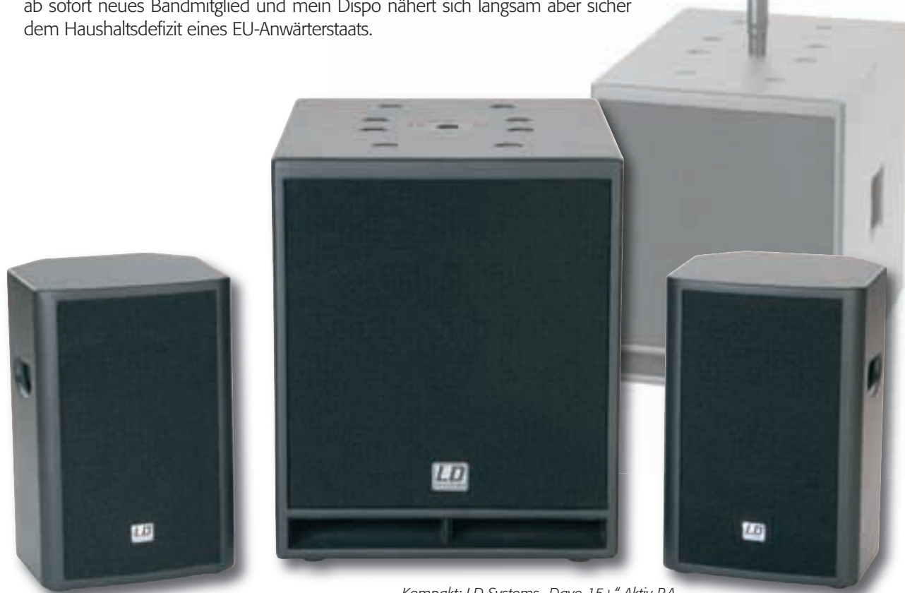
Kompakt: LD Systems „Dave 15+“ Aktiv-P.A.

Manchmal hasse ich meinen Job. Viele mögen denken, dass man als tools-Autor Ruhm, Geld und Glück gleich säckeweise nach Hause fährt. Was soll ich lange herum reden, dem ist natürlich auch so. Aber es gibt auch Schattenseiten im Autorentendasein. Schlimm ist es, wenn man knietief im Dispo wadet, aber das Testobjekt einfach kaufen muss, weil es einem persönlich wirklich gut gefällt. Am schlimmsten ist es allerdings, wenn man vergisst, seine Tabletten gegen Gruppenzwang einzunehmen. Nachdem ich dem Drummer meiner Hausband unseren Kandidaten, die kompakte „Dave 15+“ Aktiv-P.A. von LD Systems, zum Ausprobieren für sein E-Drum Set angeboten hatte, wurde schnell klar: „Dave“ ist ab sofort neues Bandmitglied und mein Dispo nähert sich langsam aber sicher dem Haushaltsdefizit eines EU-Anwärterstaats.