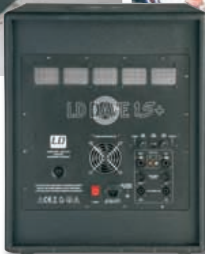
Die Rückseite mit allen Anschlüssen inklusive Volex-Buchse

Der Aufbau des „Dave“-Systems ist stets der gleiche: Der Sub versorgt zwei Satelliten, beherbergt die dazu nötigen drei Endstufenkanäle und stellt zudem alle Ein- und Ausgänge parat. Schön, dass trotz der moderaten Preisgestaltung die In/Out-Sektion nicht auf ein Minimum zusammengestrichen wurde. Um den guten „Dave“