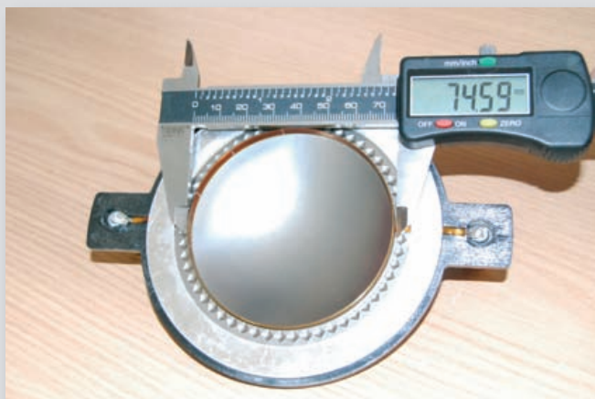
Abb. 4: Schweres Geschütz: Die Aluminiumkalotte eines 1,4-Zoll-Hochtontreibers mit 75-mm-Schwingspule (entspricht 3 Zoll), was der traditionellen „Standardgröße“ für einen Treiber mit 1,4-Zoll-Öffnung entspricht