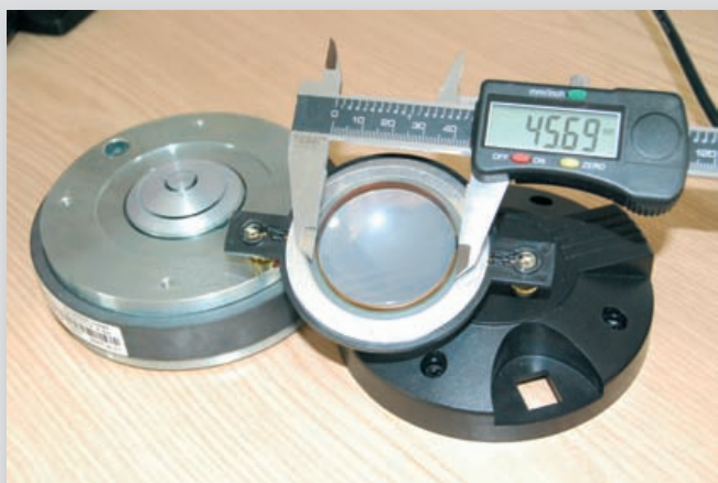
Abb. 3: Ein Hochtontreiber mit transparenter Kunststoffmembran und 44-mm-Schwingspule – diese „Standardgröße“ für 1-Zoll-Treiber (1,75 Zoll VC-Durchmesser) ist bei professionellen P.A.-Lautsprechern häufig anzutreffen