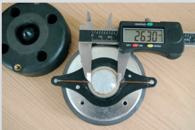
Abb. 2: Hier trifft die Schieblehre auf einen sehr weit verbreiteten Hochtontreiber italienischer Herkunft, der momentan in vielen Boxen der 500-Euro-Klasse (und manchmal auch höherpreisigen Exemplaren) verwendet wird – der Schwingspulen-durchmesser liegt hier bei ca. 25 mm (entspricht 1 Zoll)