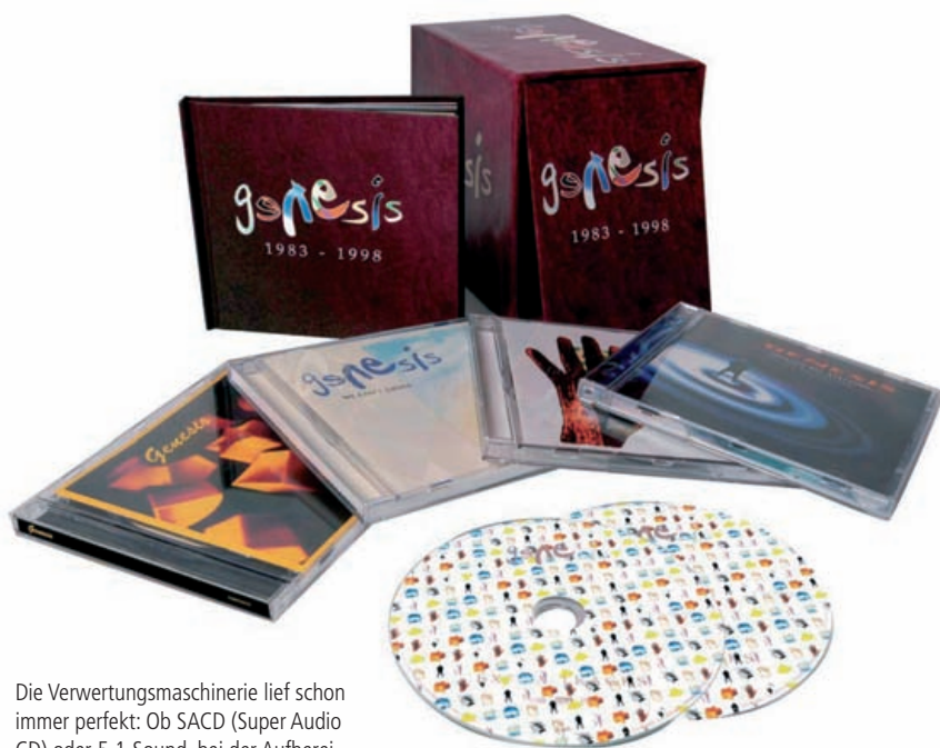
Die Verwertungsmaschinerie lief schon immer perfekt: Ob SACD (Super Audio CD) oder 5.1-Sound, bei der Aufbereitung des Back-Katalogs wurde nichts dem Zufall überlassen

„Gestern Abend unterhielten wir uns mit einem Reporter, der mein letztes Soloalbum regelrecht hasste“