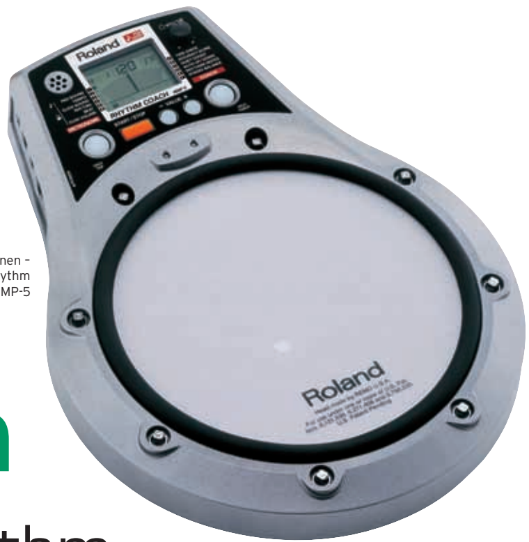
Üben und lernen - Roland »Rhythm Coach« RMP-5