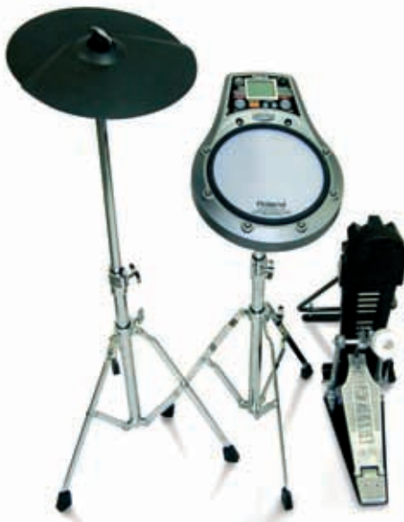
Der RMP-5 ist mit externen Pads zum kleinen Übungs-Set erweiterbar

vorliegenden Test probierte ich einen gerade erstandenen »Zen Micro« von Creative als MP3-Jukebox aus. Dadurch lässt sich der Fun-Faktor mit dem »Coach« nochmals steigern.