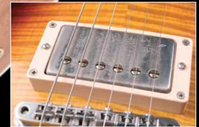
HOT PICKUPS AMBER CROSSPOINT '59 PAF