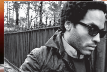
LENNY KRAVITZ IM ELECTRIC LADY STUDIO