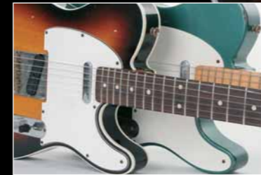
FENDER TELECASTER 50er RELIC & 60er CUSTOM LTD